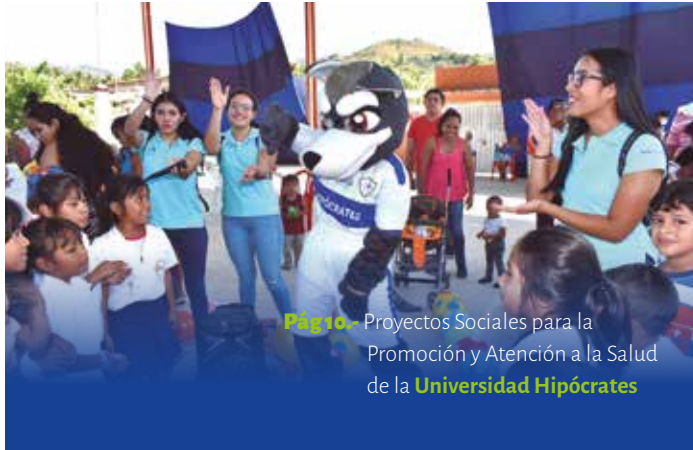
Pág 10.- Proyectos Sociales para la Promoción y Atención a la Salud de la Universidad Hipócrates

Pág 3.- Firma convenio Universidad Hipócrates con Mundo Imperial