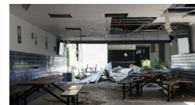
Pág. 10. Resiliencia que transforma.