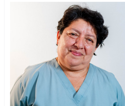
Pág. 22. Docentes emblemáticos.