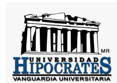
Pág. 8. La Universidad Hipócrates a través del tiempo.